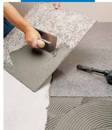
Укладка эластичного синтетического гранита с помощью серого Granirapid