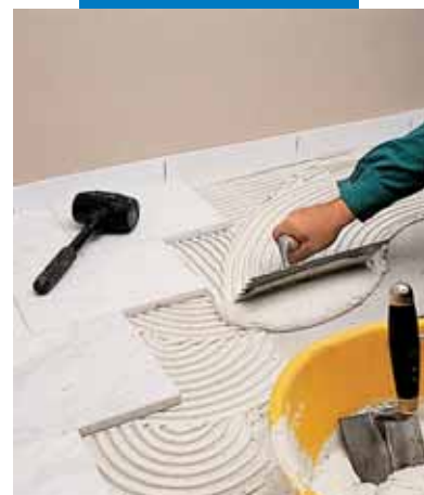
Укладка белого каррарского мрамора с помощью серого Granirapid