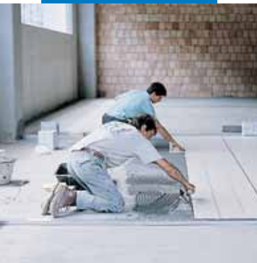
Укладка фарфоровой неглазурованной плитки в промышленных помещениях