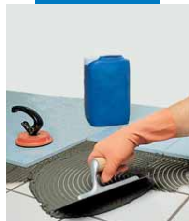
Укладка агломерата поверх имевшейся керамической плитки с использованием серого Granirapid